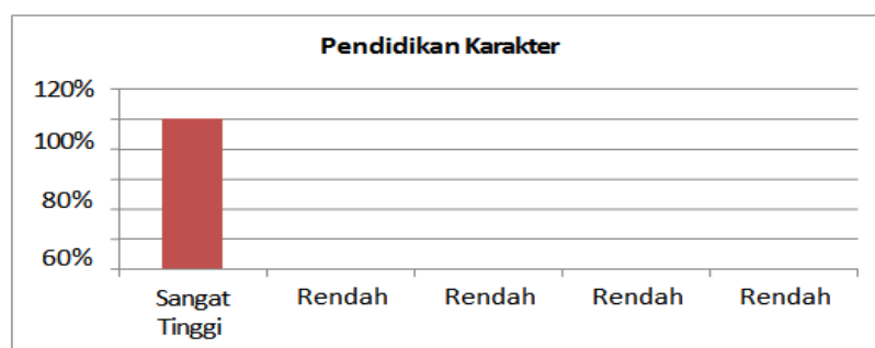
Gambar 1. Diagram Pendidikan Karakter

Berdasarkan tabel di atas, maka frekuensi pendidikan karakter berada pada kategori sangat tinggi sebesar 100% atau memiliki rata-rata 71.25.