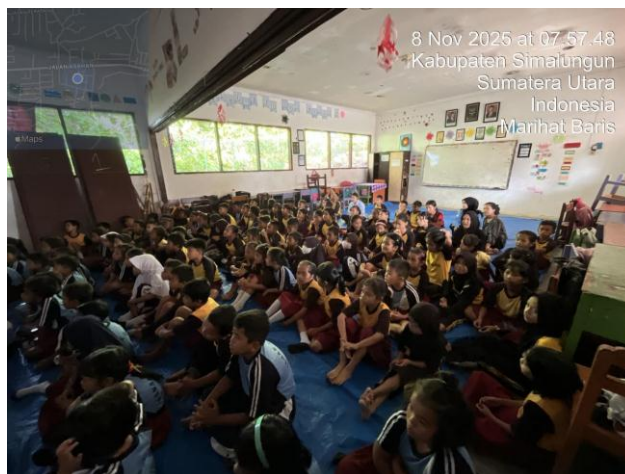
Gambar 1. Pengumpulan Siswa

Kegiatan sosialisasi yang dilaksanakan pada Sabtu, 8 November 2025 di SD Negeri 091281 Batu IV berjalan dengan lancar dan interaktif. Fokus utama dari hasil kegiatan ini adalah transformasi pemahaman siswa dari ketidaktahuan menjadi kesadaran kritis mengenai bahaya perundungan.