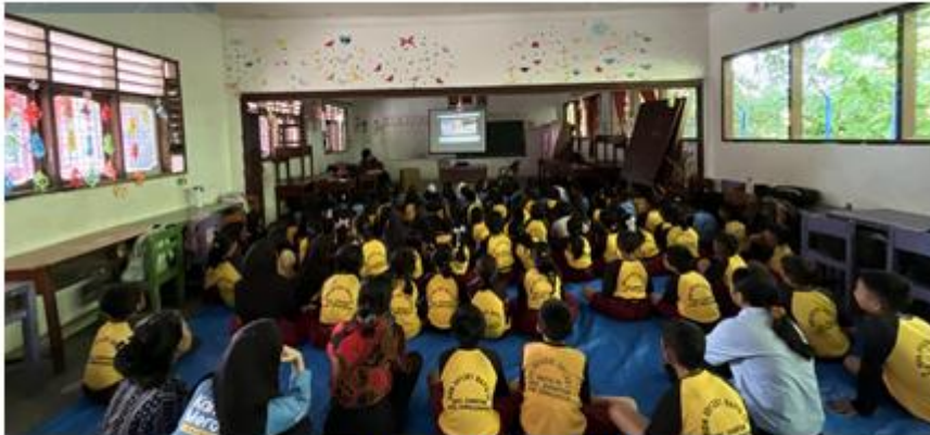
Gambar 3. Penayangan Video

Penggunaan video animasi edukasi pada sesi pukul 09.15 WIB terbukti menjadi instrumen paling krusial dalam menyentuh aspek afektif siswa. Observasi menunjukkan perubahan suasana yang signifikan saat penayangan video; siswa yang sebelumnya gaduh menjadi tenang dan fokus memperhatikan penderitaan karakter korban dalam video. Secara psikologis, visualisasi tersebut menjembatani pemahaman siswa tentang dampak perundungan yang sulit dijelaskan hanya dengan kata-kata. Respons emosional siswa, seperti ekspresi sedih dan rasa bersalah yang muncul saat diskusi pasca-nonton, mengindikasikan bahwa pesan moral “Jadilah Teman, Bukan Perundung” telah meresap ke dalam kesadaran mereka. Siswa secara spontan menyatakan komitmennya untuk lebih peduli terhadap perasaan teman sebaya. Sesi dialog interaktif mengungkap dinamika sosial yang terjadi di sekolah. Banyak siswa yang mulai berani bersuara mengenai pengalaman mereka menyaksikan ejekan di kelas. Pembahasan difokuskan pada peran siswa sebagai upstander (pembela), bukan hanya sebagai bystander (penonton). Peneliti menekankan tiga langkah praktis yang disepakati oleh seluruh siswa: